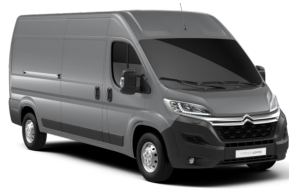
M0F4 | Gris Acier (metalliväri)