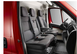
35FX | Darko kangasverhoilu