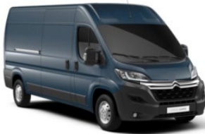
M0ZW | Gris Fer (metalliväri)