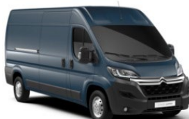
M0ZW | Gris Fer (metalliväri)