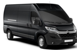
M0E9 | Gris Graphito (metalliväri)