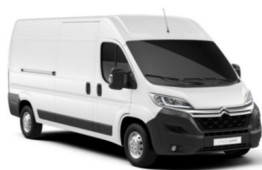
POPR | Ice White (perusväri)