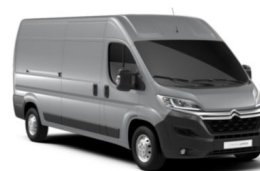
M0ZR | Gris Aluminium (metalliväri)