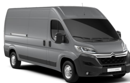
M0F4 | Gris Acier (metalliväri)